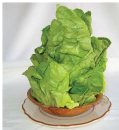
Régulière: 12,75 $