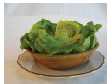
La frugale: 5,75 $