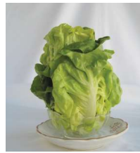
Petite: 6,75 $